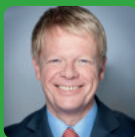
Reiner Hoffmann DGB-Vorsitzender