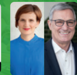
Katja Kipping & Bernd Rixinger Parteivorsitzende/r DIE LINKE