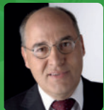
Dr. Gregor Gysi MdB & Vorsitzender Europäische Linke