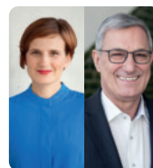
Katja Kipping & Bernd Riexinger Parteivorsitzende/r DIE LINKE