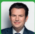
Hubertus Heil Bundesarbeitsminister & Schirmherr