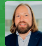
Dr. Anton Hofreiter Fraktionsvorsitzender Bündnis 90 / Die Grünen