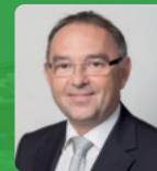
Dr. Norbert Walter-Borjans Parteivorsitzender der SPD