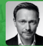
Christian Lindner Bundesvorsitzender FDP (angefragt)