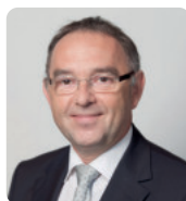
Dr. Norbert Walter-Borjans Parteivorsitzender der SPD