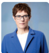
Annegret Kramp-Karrenbauer Parteivorsitzende CDU (angefragt)

Politik hautnah! Nutzen Sie den Deutschen BetriebsräteTag als Chance, den SpitzenvertreterInnen der Parteien Fragen zur aktuellen politischen Lage zu stellen und Ihre betrieblichen Themen mitzugeben.