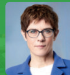
Annegret Kramp-Karrenbauer Parteivorsitzende CDU (angefragt)