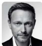
Christian Lindner Bundesvorsitzender FDP (angefragt)