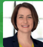
Leonie Gebers Staatssekretärin im Bundesarbeitsministerium