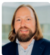
Dr. Anton Hofreiter Fraktionsvorsitzender Bündnis 90/Die Grünen